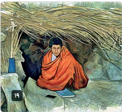
طراح: سمان رحیمی

افزایش قیمت کالاها دیگر عادی شده و بخشی از آنها حتی به قانون تبدیل شده است