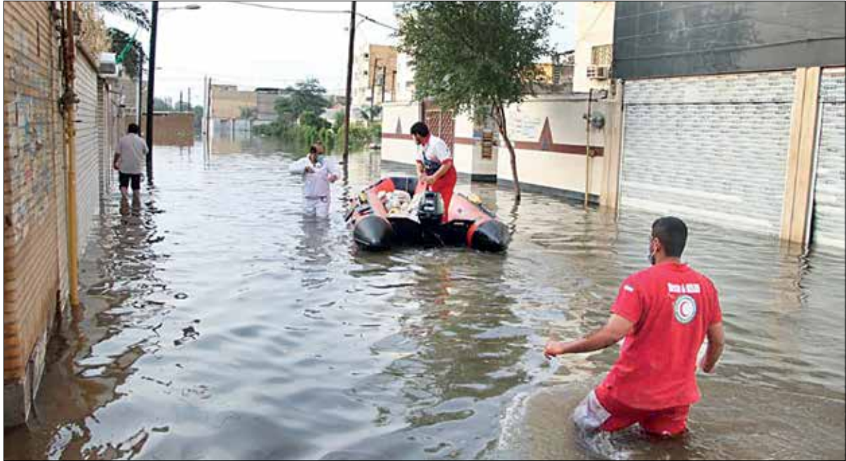
این همان اهوازی است که هیچ بهره‌ای از زیرساخت‌های شهری نبرده است

متأسفانه قضیه شهرداری و آب‌وفاضلاب در اهواز جوری است که انگار اینها دشمن همدیگر هستند نه مکمل همدیگر. از هرکدام هم پرسری مقصر این آبگرفتگی کیست، می‌گویند آن یکی نه!؛ درحالی‌که همه‌جای کشور جمع‌آوری آب‌های سطحی در حیطه مسؤولیت‌های شهرداری است که اینجا این را گردن نمی‌گیرد. از طرف دیگر به آب‌وفاضلاب هم بگویی آبی‌که کف خانه‌های ماست از فاضلاب خانه بیرون زده و برگشت داده باز قبول نمی‌کند. ما هم که یک شهر باران‌زا