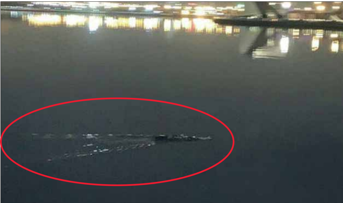
برخی به این تصویر استاندارد و ادعای گنبد در دریاچه چیتگر تمساح دیده شده است

ما درباره سرنوشت حیوانات خانگی سه نفر از هموطنان مان که زمانی به خانه‌هایشان برده بودند با آنها البته به‌شرط مخفی ماندن نامشان حرف زدیم که همگی روایتگر زجری بود که آن حیوانات دیده‌اند. یکی از آنها که تنها دلیلش برای نگهداری حیوانات وحشی در خانه، دوستش بوده که حیوانات عجیب‌وغریب نگهداری