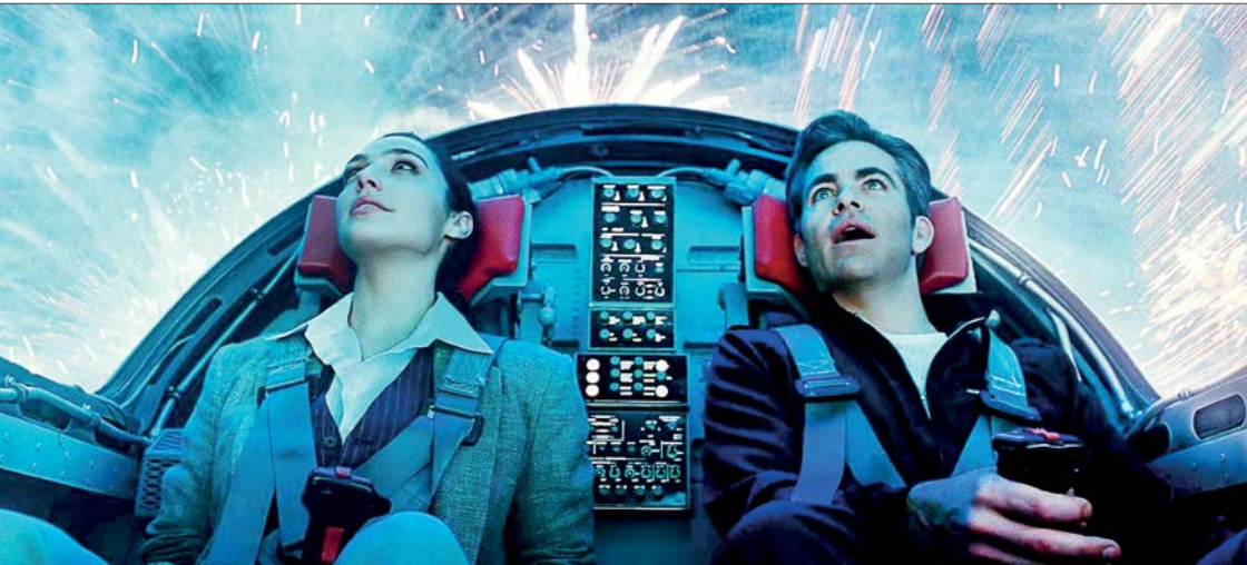
نمایش از واندروومن۱۹۸۴

مجموعه بدون نام کریستین اسکات تامس، با حال و هوایی هیجانی، دلهره‌آور و اکشن جلوی دوربین می‌رود. نام موقت این اکشن جاسوسی «اسب‌های آرام» است و جاناتان پرایس، هنرمند کهنه‌کار سینما نقش مقابل تامس را در آن به‌عهده دارد. شبکه اپل تهیه‌کننده اسب‌های آرام است که داستانش را از نوول پرخواننده میک هرن به همین نام گرفته است. قرار است گری اولدمن هم به جمع بازیگران مجموعه اضافه‌شود. داستان مجموعه درباره یک مامور ام‌آی‌فایو است که در حال انجام ماموریتی مهم با حوادث پیش‌بینی نشده‌ای روبه‌رو می‌شود./ ددلاین