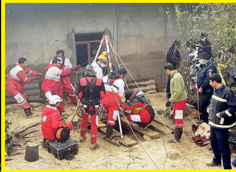
اجساد در حال خارج کردن جسد از چاه

به گزارش جام جم، سرهنگ امین یادگار نژاد، رئیس پلیس فتای استان کرمان دراین باره گفت: فردی با حضور درپلیس فتا شکایت کرد که چندی پیش در یکی