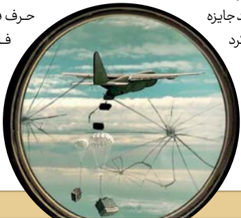
به امید حق. ❦

باتری‌های دوربین را شارژ می‌کردم، حافظه دوربین را خالی می‌کردم و برای ادامه فیلمبرداری می‌رفتم تا دو ساعت روز بعد. مورد دیگر این‌که در حلب، هیچ قانونی برای تصویربرداری وجود نداشت. محیط نظامی و جنگی بود. کسی نمی‌پرسید از کجا آمده‌ای، مجوز داری؟ اصلاً به چه حقی فیلم می‌گیری؟ این وضعیت هم سهل بود و هم سخت. چون این شرایط جنگی باعث می‌شد در بعضی جاها اصلاً بی‌خیال شما شوند و کاری به کارتان نداشته باشند و هم بعضی جاها خیلی سخت می‌گرفتند. این‌که من یک‌نفره رفتم، یک انتخاب نبود، یک اجبار بود. یعنی لزوماً به این معنی نیست که فیلمسازی یک‌نفره، فیلمسازی درستی است. اگر گروهی وجود داشته باشد و اعضا کار تخصصی خودشان را انجام دهند، قاعدتاً فیلم بهتر می‌شود. اما شما مجبورید در آن شرایط، یک‌نفره بروید، بیشتر هم به دلیل مسائل امنیتی. چون هر شب در شهر صدای خمپاره و تیر و ترکش می‌آمد. شرایط بحرانی یعنی همین، یعنی شرایطی که هیچ چیز در آن قابل پیش‌بینی و قابل برنامه‌ریزی نیست. ❦