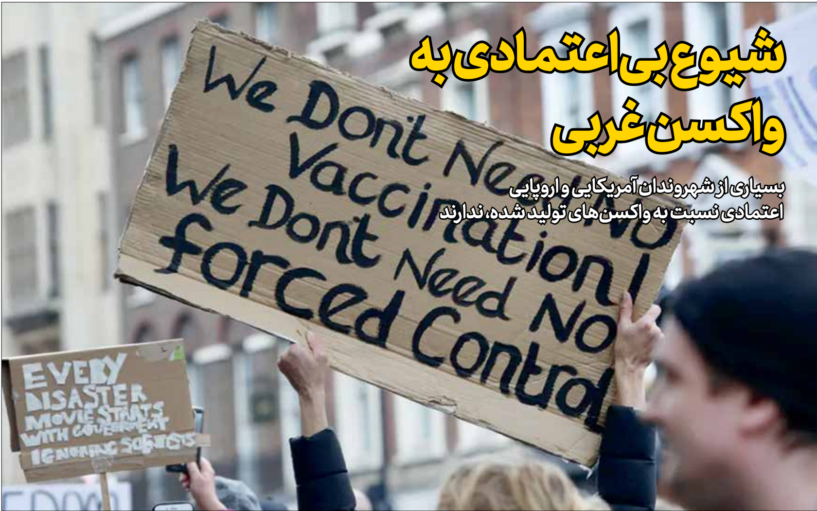
باتولید واکسن کرونا توسط برخی شرکت‌های آمریکایی و اروپایی، شاهد فعالیت‌های ضد واکسن در اتحادیه اروپا هستند

بسیاری از شهروندان آمریکایی و اروپایی اعتمادی نسبت به واکسن‌های تولید شده، ندارند