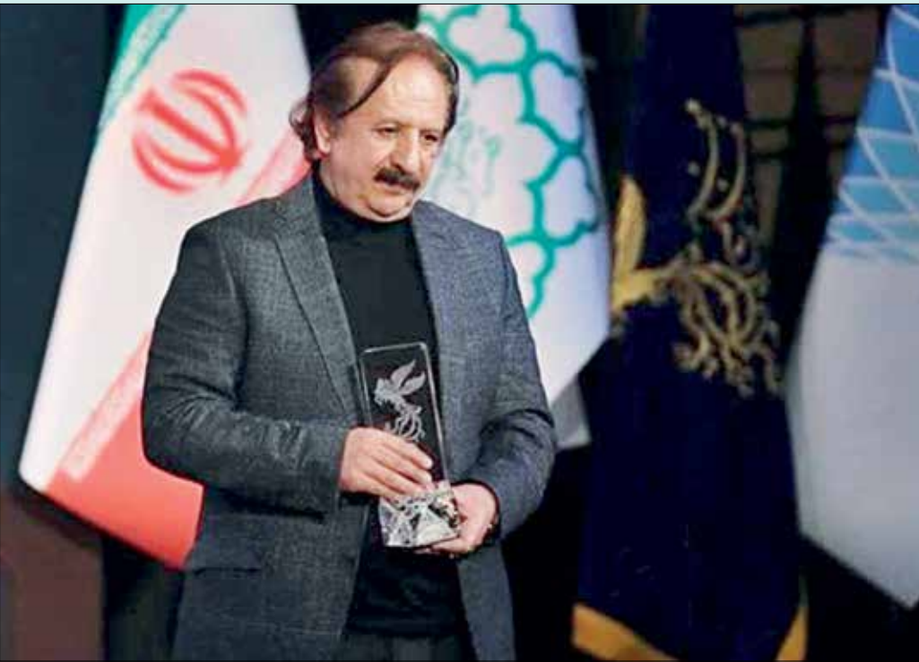
مجید مجیدی برای ساخت «خورشید» از بهترین سیمرغ جشنواره فجر شد

جشنواره بین‌المللی فیلم کوتاه تهران، جشنواره بین‌المللی سینما حقیقت (فیلم مستند ایران)، جشن خانه سینما، جشن سینمایی و تلویزیونی حافظ، جشنواره فیلم مقاومت، جشنواره بین‌المللی فیلم‌های کودکان و نوجوانان و ... از دیگر رویدادهای سینمایی مهم ایران هستند.