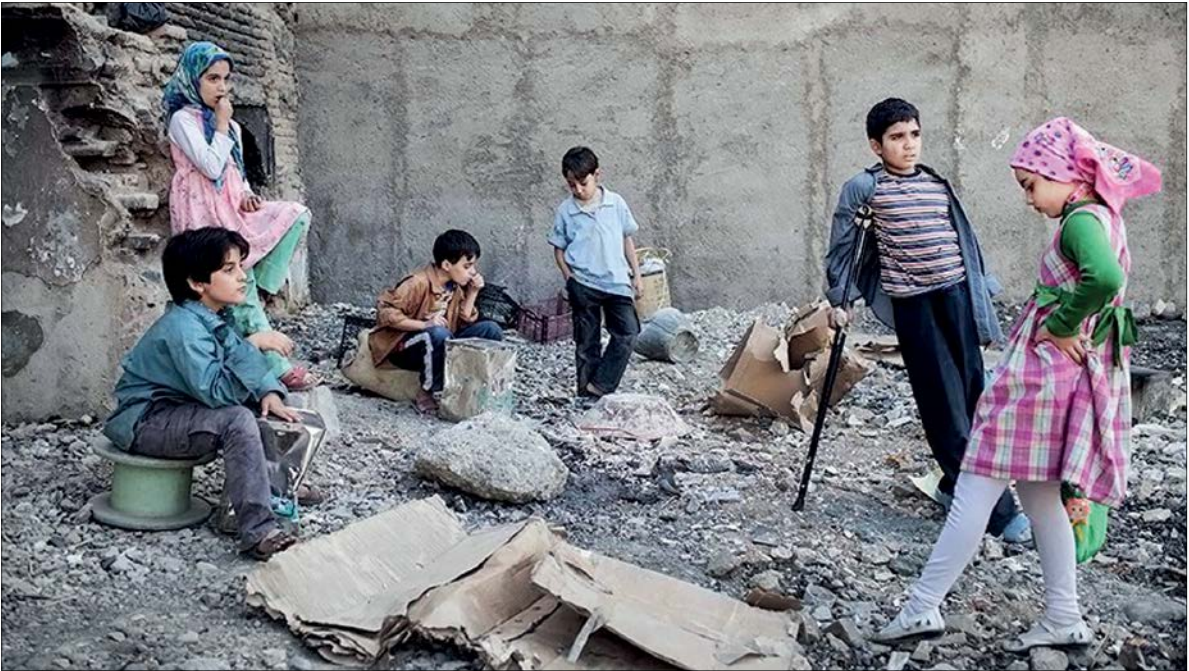
نمایی ازسریال آوای باران که با محوریت کودکان کار و پاندهای تکی‌روی آنتن رفت