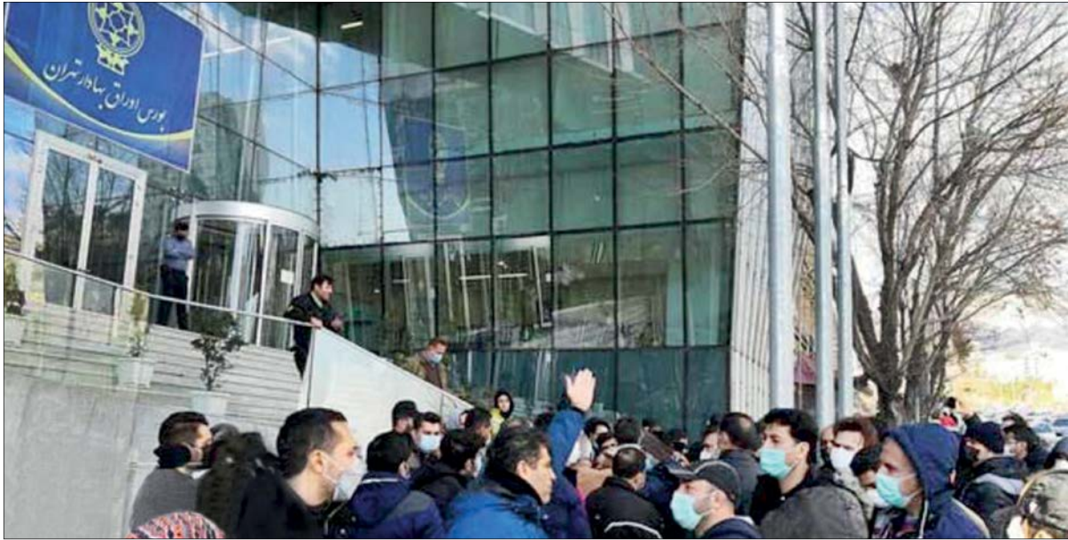
تجمع سهامداران در مقابل ساختمان بورس در روزهای اخیر

مدیر مرکز تماس شرکت سپرده‌گذاری مرکزی از پذیرش چند شرکت سرمایه‌گذاری استانی در بورس خبر داد و گفت: تاکنون ۲۶ شرکت سرمایه‌گذاری استانی پذیرش شده و ۶ شرکت سرمایه‌گذاری استانی دیگر باقی مانده‌اند که به‌محض اتمام انجام مراحل پذیرفته‌شدن در بازار سرمایه و قیمت‌گذاری آنها، در تابلوی معاملات بورس قرار