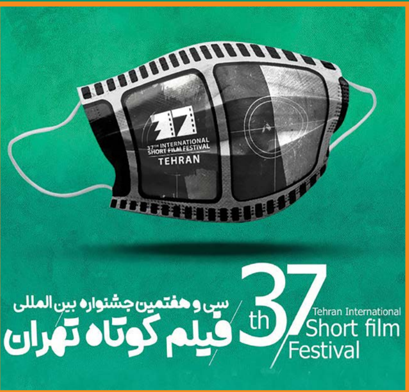
سی و هفتمین جشنواره بین‌المللی فیلم کوتاه تهران امروز به کار خود پایان می‌دهد.