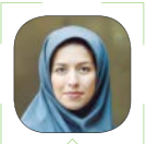
عسل اخوان طهرانی

همچنین برای بخش دیگری از مخاطبان صندوق که شرکت‌های دانش‌بنیان تولیدی بزرگ هستند، ظرفیت جدیدی برای بهره‌مندی از خدمات شبکه بانکی کشور ایجاد کردیم. در همکاری و تعاملی که در این مدت با بانک‌ها ایجاد شد، این شرکت‌ها برای تأمین مالی به بانک‌ها معرفی می‌شوند. در این تعامل، از یک سو، بانک‌ها به