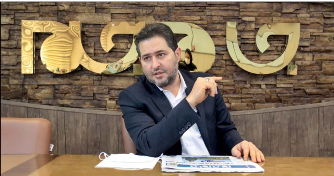
رئیس هیات عامل صندوق نوآوری و شکوفایی

براساس آن هر شرکتی که بتواند بخش خصوصی را برای تأمین بخشی از سرمایه مورد نیاز خود مجاب کند، ما با هم سرمایه‌گذاری تا چهار برابر آن مبلغ در شرکت سرمایه‌گذاری خواهیم کرد و آن سرمایه‌گذار خصوصی به‌عنوان عامل ما در شرکت فعالیت خواهد کرد. این روشی بود که در دنیا دولت‌ها برای تحریک صنعت سرمایه‌گذاری خطرپذیر (VC) به‌کار می‌گیرند و ما هم در ایران آن را شروع کردیم.