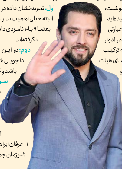
خبری از سومین سیمرغ بهرام رادان نیست

نگاهی به فیلم «تی‌تی» ساخته آپدا پناهنده