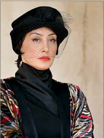
هیات داوران بازی‌هایه تهرانی در فیلم «بی‌همه چیز» را ندید

فیلم ما که هستیم؟ به کارگردانی و تهیه‌کنندگی ابوالحسن کیوان در سه جشنواره جهانی به عنوان بهترین فیلم شناخته شد. هنرآلاین خبر داد این فیلم به‌عنوان بهترین فیلم بین‌المللی جشنواره راکی ماتین در آمریکا بهترین فیلم درام جشنواره فیلم سیلک رود در فرانسه و بهترین تهیه‌کننده در پنجمین دور جشنواره سینمای اروپا یو یوروپین سینما تگرافی اوارز در آمستردام هلند سال ۲۰۲۰ انتخاب شد.