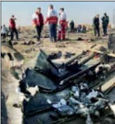
تصاویر مربوط به پرونده کوری

شاکی در پاسخ به ادعای متهم گفت: من فقط مشروبی که از متهم خریده بودم را مصرف کردم و بعد از آن دیدم تار شد. پس از دفاعیات متهم و وکیل مدافعش قضات مرد ساقی را به پرداخت دیه به شاکی و تحمل زندان محکوم کردند.