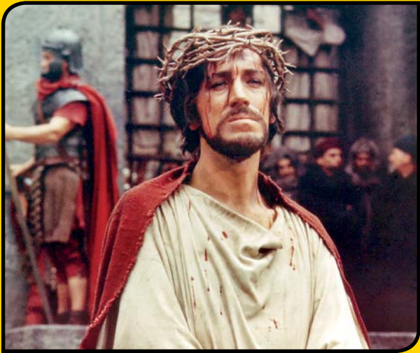
بزرگ‌ترین داستان عالم