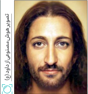
تصویر هوش مصنوعی از مسیح (ع)