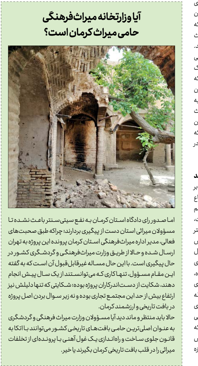
آيا وزارتخانه ميراث فرهنگي حامی ميراث کرمان است؟

پنهان از چشم وزیر ابراهیمی ادامه می‌دهد: شمال این پروژه نیز به میدان ارگ متصل می‌شود؛ میدانی که ثبت ملی است و میدان باغ ارگ را شامل می‌شود. متأسفانه تمام مغازه‌هایی که پیشتر