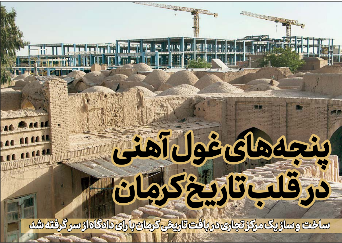
ساخت و ساز یک مرکز تجاری در بافت تاریخی کرمان با رای دادگاه از سر گرفته شد