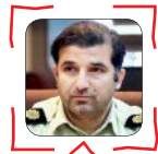
سرهنگ رامتین پاشایی

از سوی دیگر، هنگام وارد کردن رمز مطمئن شوید دوربین مداربسته از شما فیلمبرداری نمی‌کند (رمز را متوجه نمی‌شود). هنگام کشیدن کارت مطمئن شوید دستگاه کارتخوان شکسته، چسب خورده یا دارای قطعه اضافی نباشد. این مشکلات می‌تواند نشانه وجود دستگاه اسکیم باشد. اگر متوجه شدید دستگاهی چنین مشکلاتی را دارد، می‌توانید از طریق سایت پلیس فتا، این مورد را گزارش دهید. اگر احساس کردید شاید از یک دستگاه کارتخوان استفاده کرده‌اید که به اسکیم وصل بوده، به سرعت رمزتان را تغییر دهید. هر ماه و به صورت منظم رمز کارت بانکی خود را تغییر دهید. رمزتان را در اختیار فروشندگان دوره‌گرد قرار ندهید که دستگاه کارتخوان دارند.