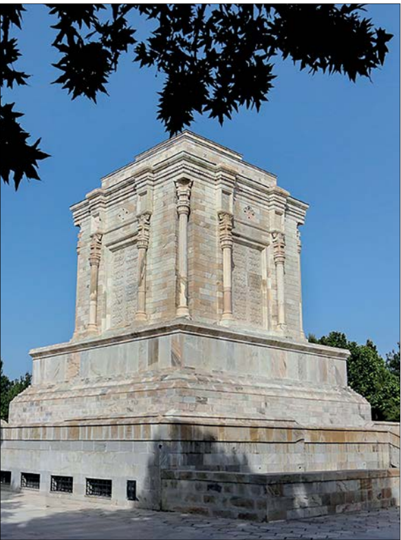
نمایی از آرامگاه حکیم توس، فردوسی بزرگ / عکس: میزبان

است، گردشگری دوباره در سطح دنیا فعالیت خود را آغاز کند. وی خطاب به سفیر ارمنستان یادآور شد که ایران می‌تواند برای آشناسازی معرفی ظرفیت‌های گردشگری ایران فم‌تور متشکل از خبرنگاران و آژانس‌های گردشگری برگزار کند که این موضوع می‌تواند موجب افزایش تعداد گردشگران شود. /میراث آریا