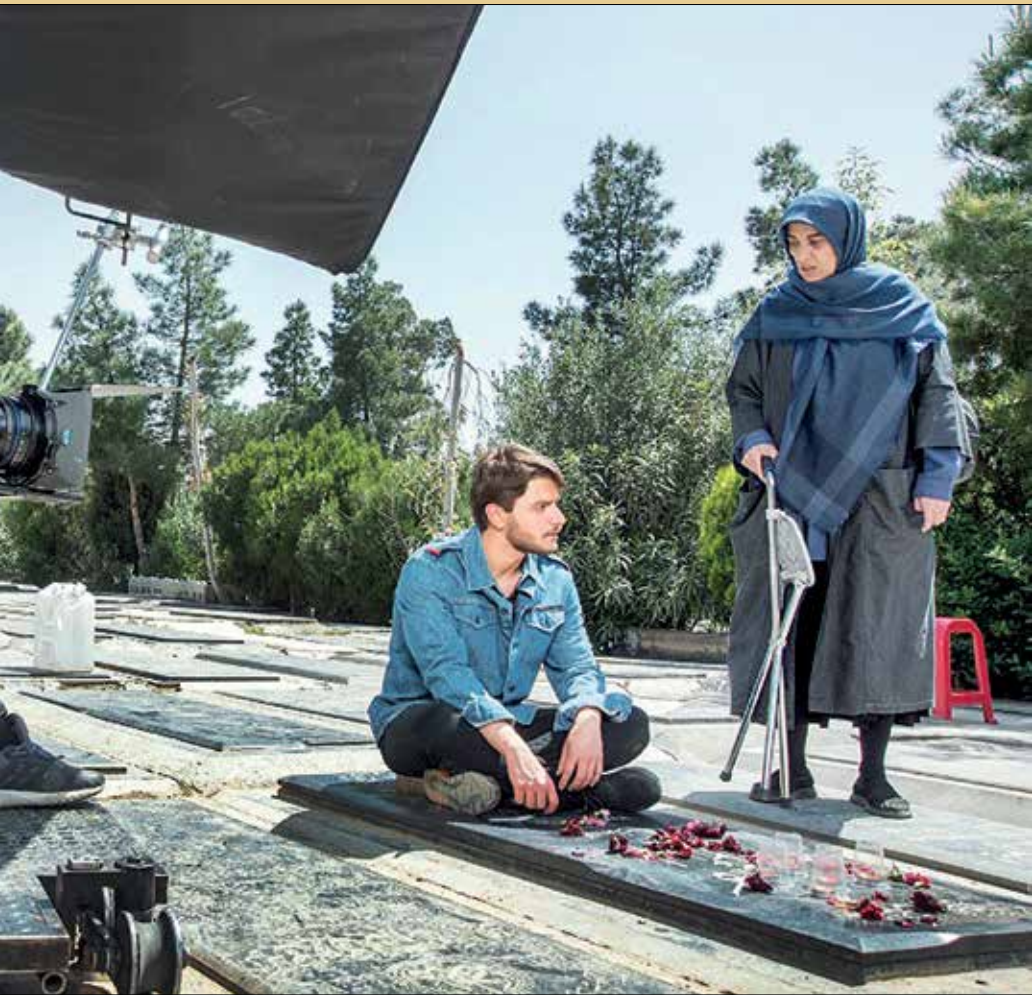
سهراب و هاشم در فصل چهارم با ماجراهای تازه‌ای روبه‌رو می‌شوند

بعد از انقلاب نیز وارد سپاه شد و از اولین افرادی است که سپاه را تشکیل داد و تا لحظه شهادت دلاورانه در جبهه‌ها حضور داشت. مرکز سیمافیلم سریال شهید باکری را هم به کارگردانی هادی حجازی‌فرو تهیه‌کنندگی ابوالفضل صفری در دست تولید دارد که هم اینک گروه مشغول تصویربرداری در خوزستان هستند.