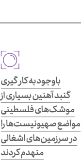
باوجود به کارگیری