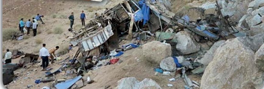
آخرین عکس سربازان

قبل از شروع سال تحصیلی قرار بود دانش‌آموزان نخبه هرمزگانی به اردوی فرزنانگان بروند. نهم شهریور ۹۶ دانش‌آموزان نخبه رودان و میناب برای اردو به سمت میناب حرکت کردند، دانش‌آموزان دختر مقطع راهنمایی در مسیر بگو بخند راه انداخته بودند و سعی می‌کردند در این فرصت به درس فکر نکنند. همه چیز خوب پیش می‌رفت تا این که اتوبوس به نزدیکی روستای قلعه بیابان رسید، دختران متوجه حرکت غیرعادی اتوبوس شده و شروع به داد و بیداد کرده و همدیگر را بغل کردند اما به یکباره اتوبوس واژگون شد و بامداد خونینی را رقم زد. از ۴۴ دانش‌آموز دختر حاضر در اتوبوس ۱۱ نفر جان خود را از دست دادند و ۳۳ نفر مجروح شدند. بعد از حادثه اردوی دانش‌آموزی تعطیل شد و راننده اتوبوس به علت خستگی و خواب‌آلودگی مقصر حادثه شناخته شد.