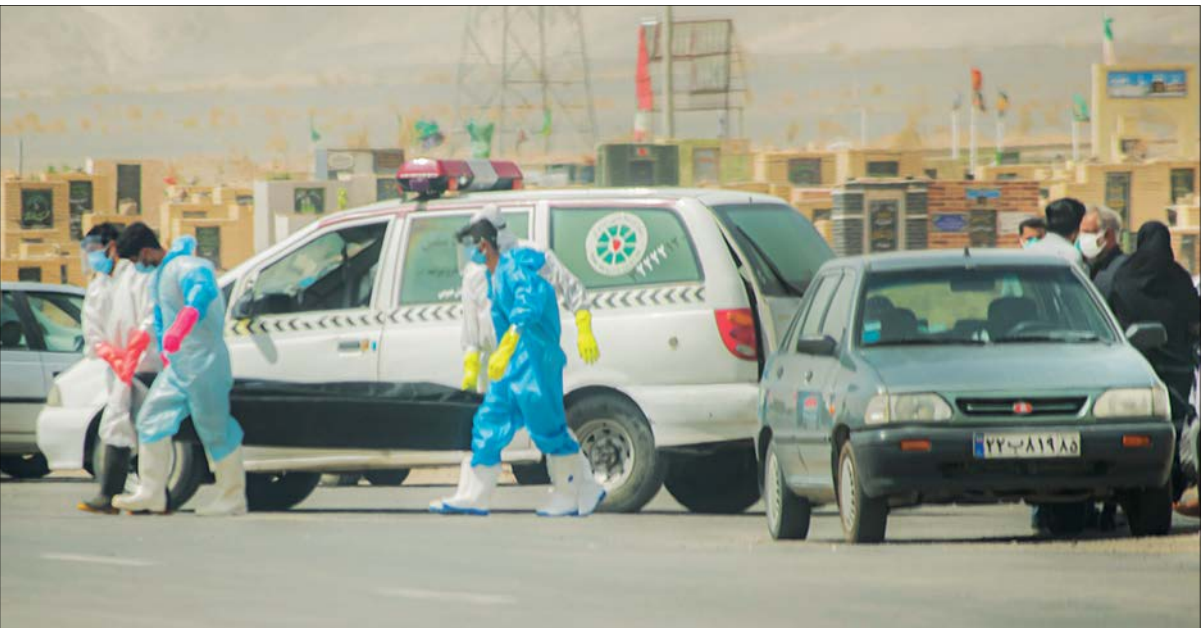
آر استانبول پشت محمدسول - شلوغ ترین روزهایش را تجربه می کند

آخرین رنگ‌بندی شهرهای کشور از نظر شیوع ویروس کرونا از سوی وزارت بهداشت منتشر شد و بر این اساس ۹۲ شهرستان در وضعیت قرمز، ۱۸۳ شهرستان در وضعیت نارنجی و ۱۷۳ شهرستان در وضعیت زردکروناایی قرار دارند. براساس گزارش وزارت بهداشت، شیوع سویه‌های جدید ویروس و کاهش