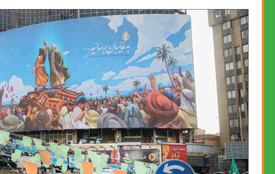
دیوارنگاره میدان ولی‌عصر به مناسبت عید غدیرخم