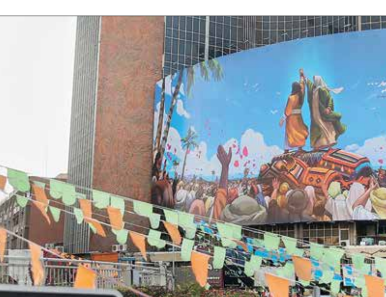
دیوارنگاره میدان ولی‌عصر به مناسبت عید غدیرخم

کاظم(ع) در شهرهای شیعه‌نشین قم، دیلمان سابق یا همان مازندران امروز، ری و سبزوار ساکن بوده‌اند.