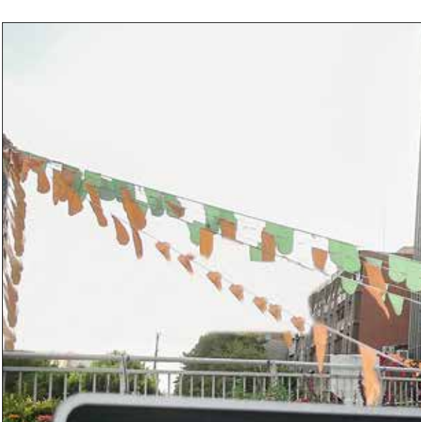
دیوارنگاره میدان ولی‌عصر به مناسبت عید غدیرخم

اصلی چند سرشاخه دیگر هم اضافه شده که عبارتند از: سادات علوی غیرفاطمی که از نسل حضرت عباس و محمد حنفیه پسران حضرت علی(ع) هستند، سادات طالبی غیر علوی که از نسل عبدا... جعفر و عقیل بن ابی طالب هستند. سادات نقوی از نسل امام هادی(ع) و سادات جعفری که از نسل امام صادق(ع) هستند.