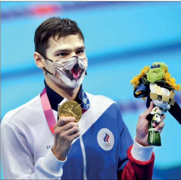
قهرمان روس ۲۰۰ متر قورباغه با ماسک مخصوص روی سکو