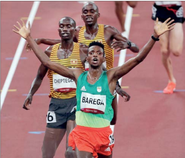
اولین طلای دو و میدانی المپیک توکیو به ورزشکار اتیوپیایی رسید