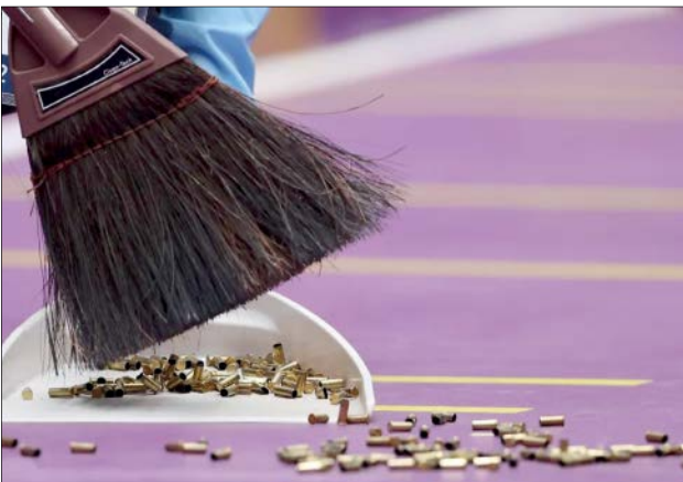
جمع کردن پوکه ها بعد از پایان مسابقه تیراندازی