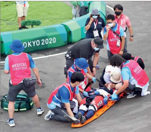
مصدمیت شدید دوچرخه سوار آمریکایی در بازی های بی ام ایکس توکیو