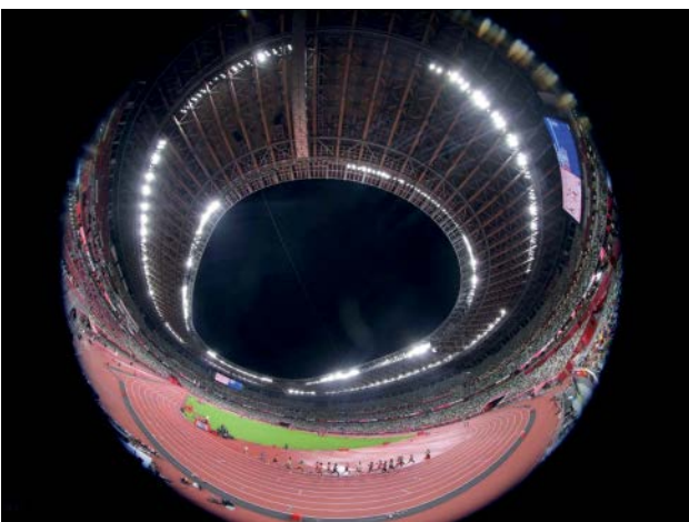
تصویری بالنز چشم ماهی از فینال مسابقه دوی ۱۰ هزار متر