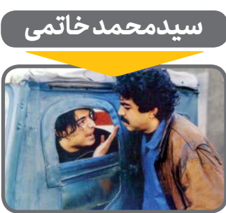
نشان عشق و موتور ۱۰۰۰

شخصیت و فـراز و نشیب‌های مختلف زندگی و مسؤولیت‌های سیاسی خاتمی، قابلیت تبدیل‌شدن به فیلمی پرکشش را دارد. ضمن این‌که حضورهای جهانی خاتمی و بحث گشت‌وگویی تمدن‌ها که توسط او در دوران ریاست‌جمهوری مطرح شد، حتی می‌تواند کنجکاوی‌هایی خارج از مرزهای کشور را هم درباره ساخت فیلمی درباره او ایجاد کند. با پیروزی خاتمی در انتخابات سال ۷۶، فضای جامعه به‌ویژه فرهنگ و هنر و همچنین سینما تغییر کرد که تأثیرات آن غیرقابل انکار است. با این حال حتی این سابقه و پشتوانه هم باعث اعتنای جدی سینما به این شخصیت پیچیده‌سیاسی نشده‌است. تنها شاید بتوان به فیلم کمدی ژان، عشق و موتور ۱۰۰۰» به کارگردانی ابوالحسن داوودی اشاره کرد که ارجاعات بانمکی به حضور رئیس‌جمهور وقت یعنی خاتمی داده می‌شود. در پایان فیلم، ارشک (سپند امیرسلیمانی) و داریوش (رضا آحادی) که از دست آدم‌ربایان فرار کرده‌اند و کنار جاده هستند، به یک کارناوال اسکورت و موتور ۱۰۰۰ برمی‌خورند. در لیموزین مشکی برای کمک و سوارکردن آنها باز می‌شود و وقتی ارشک خودش را برای تشکر به ماشین می‌رساند، با رئیس‌جمهور ایران مواجه می‌شود. برای همین با تعجب می‌گوید: «نه! آقای خاتمی» و دوان دوان می‌رود تا این تعجب و ذوق‌زدگی را به دوستش هم منتقل کند.