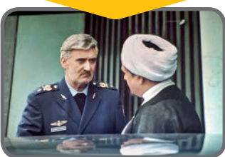
نمایی از فیلم منصور

حضرت آیت... سیدعلی‌خانم‌ای، رهبر انقلاب اسلامی، به‌عنوان سومین رئیس‌جمهور ایران، ظرفیت‌های ویژه و بالایی برای روایت سینمایی دارند اما ترکیب احتمالاً خودداری ایشان از ساخت فیلمی مرتبط و ملاحظات رسمی، باعث شده تاکنون این اتفاق رخ ندهد. آشنایی با شهید نواب‌صفوی در دوره نوجوانی، آشنایی باحضرت امام‌خمینی(ره) و تأثیرپذیری از امام و کسب روحیه انقلابی، مبارزات ایشان در سال‌های پیش از انقلاب، دستگیری‌ها و تبعید در دوران حکومت پهلوی، جانبازی در پی اقدام تروریستی گروه فریقان، دوران ریاست‌جمهوری و ... نشان از ظرفیت بالای روایت سینمایی و حتی تلویزیونی دارد. اما به دلایل مختلف این اتفاق تاکنون نیفتاده و تنها در برخی آثار چون ماجرای نیمروز و معمای شاه و منصور، به رهبری اشاره شده‌است.