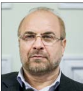
سخترانی زنده و ویدئویی رئیس‌جمهور در سازمان ملل

به گزارش جام‌جم، وزیر خارجه کشورمان در ادامه راینزهای خود در حاشیه نشست مجمع عمومی سازمان ملل با ایگنازیو کاسیس، وزیر خارجه سوئیس هم دیدار و گفت‌وگو کرد. وی در دیدار همتای سوئیسی گفت: تمایل داریم روابط دو کشور بیش‌ازپیش گسترش یابد و شاهد حضور گسترده شرکت‌های سوئیسی در طرح‌های اقتصادی و توسعه‌ای ایران باشیم.