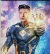
رایان رینولدز در «گای آزاد» قواعد بازی را می‌شکند و به شکل دیگری عمل می‌کند

کلویه ژائو کارگردان «نامیراها» می‌گوید داستان فیلمنامه این اکشن ابرقهرمانانه برگرفته از داستان‌های کلاسیک روم و یونان باستان است و نبرد دو نیروی خیر و شر را به شکل و زبان تازه‌ای تعریف می‌کند. او که شش ماه قبل اسکار بهترین کارگردانی را برای درام اجتماعی «بی‌سرزمین‌ها» گرفت، درباره همکاری‌اش با