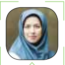
عسل اخویان طهرانی دانش

مهم‌ترین مزیت دریافت تسهیلات این است که شما کل سهام شرکت را حفظ می‌کنید در حالی که معمولاً مبلغ خوبی برای شروع و پیاده‌سازی ایده‌هایتان خواهید داشت. با وجود این، هر نوع تسهیلات بالاخره کم یا زیاد نرخ سود و کارمزدها خواهد داشت و اگر اوضاع آن طوری که ابتدا پیش‌بینی می‌کنید جلو نرود، ممکن است در ادامه با ورشکستگی و مشکلاتی در بازپرداخت اقساط روبه‌رو شوید.