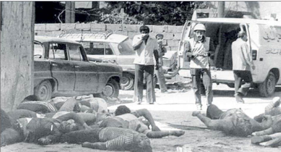
تصویری از جنگ داخلی لبنان. لبنان در آن تاریخ، سیدحسن نصرا... نداشت

وزارت خارجه عربستان سعودی به شهروندان این کشور توصیه کرد به دلایل امنیتی از سفر به لبنان خودداری کنند. این تصمیم دولت ریاض پس از درگیری‌های روز پنجشنبه گذشته و حمله به هواداران حزب... و جنبش امل لبنان در مقابل کاخ ریاست دادگستری بیروت که منجر به شهادت حداقل هفت نفر شد اتخاذ شده است. حزب... لبنان نیروهای مسیحی و وابسته به سمیر جعجع را تحت تأثیر عوامل خارجی عامل این حملات معرفی کرده است. /فارس