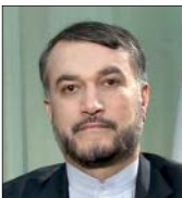
طبق نظرسنجی گروه گمان که موافق براندازی جمهوری اسلامی است ایرانیان نظر مطلوبی به قدرت‌های جهانی ندارند

امیردریادار موسوی افزود: اجرای گشت هوایی به منظور تأمین امنیت هوایی نیروهای عمل‌کننده در سطح توسط تیزپروازان نیروی هوایی ارتش و همچنین رصد و پایش آسمان منطقه عملیات توسط نیروی پدافند هوایی از دیگر اقدامات در این رزمایش بود. ✪