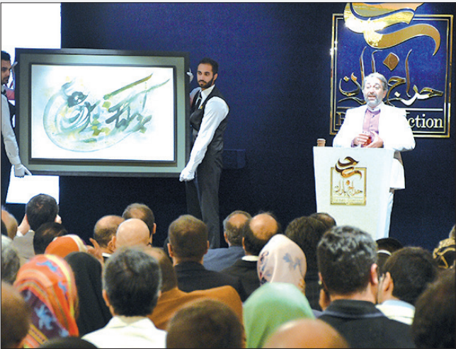
عکس‌ها مربوط به دوره دوم برگزاری حراج باران است

سومین دوره حراج باران با ارائه ۶۸ اثر از هنرهای تخصصی خط و خوشنویسی برپا می‌شود