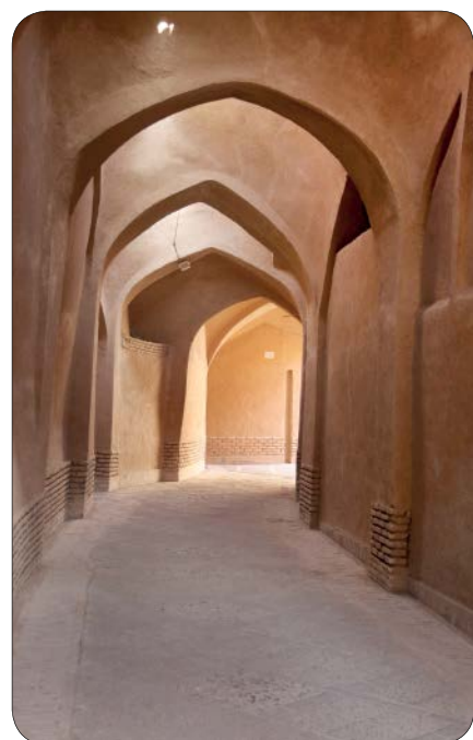
کوچه ساباط واقع در بافت سنتی شهر یزد / فاطمه عسکری