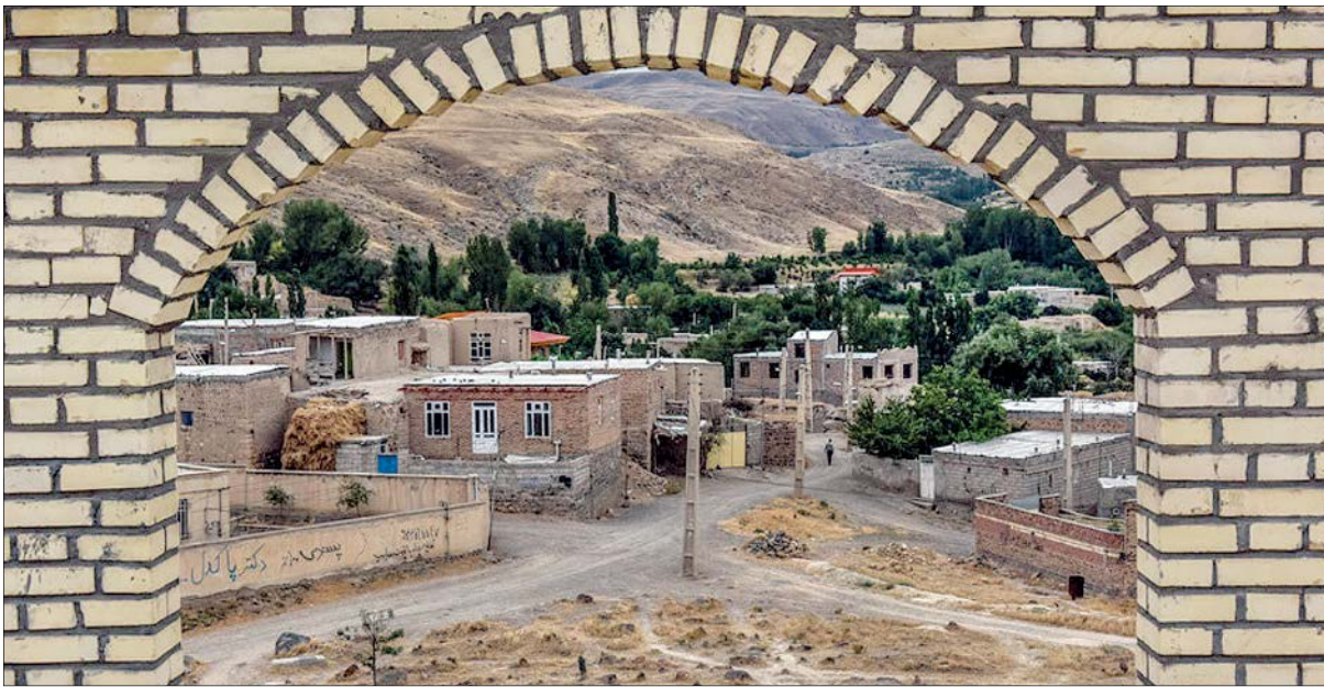
جشنواره گردشگری در روستای کلبه‌سرا، استان آذربایجان شرقی

استانی توليدات بومی و کباب گرگی محله است؛ جشنواره‌ای که شک نداریم هم خوش‌طعم و خوش عطر است و هم شاد و پر از حس زندگی. این جشنواره با هدف حمایت از تولید ملی، معرفی ظرفیت‌های گردشگری و کشاورزی مازندران و ایجاد نشاط اجتماعی در این روستا برگزار می‌شود.