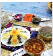
آشپزی در روستای کلبه‌سرا، استان آذربایجان شرقی

بر همین اساس برای تقویت همکاری با سازمان استاندارد، تلاش می‌کنیم و درصدد تهیه یک تفاهم‌نامه هستیم. /جام‌جم