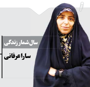
سال شمار زندگی