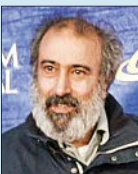
سیامک مصوری کارگردان تلویزیونی و تئاتر