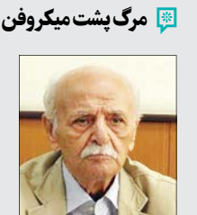
مرگ پشت میکروفن

از میان چهره‌های امروز سینما و تئاتر تعداد زیادی هستند که استعدادشان از خاک حاصلخیز رادیو جوانه زده است. چند نام را در اینجا مرور کردیم.