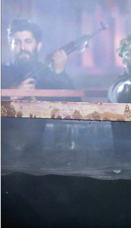
سینمایش ۴۱۰ به کارگردانی کوروش زارعی در مجموعه بازباز میدان تهران اجرا می‌شود

بازیگر دفاع مقدسی هم در این سال‌ها شناخته می‌شود. آقای زارعی هم همان لحظه با من تماس می‌گیرند و این پیشنهاد را مطرح می‌کنند، بدون اغراق می‌گویم که همان زمان برنامه سفر اربعین داشتم و با تعدادی از دوستان عازم بودم اما این قدر این پیشنهاد برای من مقدس و جذاب بود که از دوستان عذرخواهی کردم و گفتم شما بروید و سلام مرا به اباعبد... برسائید و بگویید من قرار است در یک اربعین دیگری