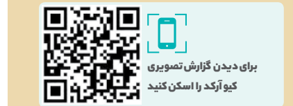
برای دیدن گزارش تصویری کیو آرکد را اسکن کنید

یکی از ویژگی‌های متمایز سریال تاریخی «چشن سربرون» حضور بازیگرانی از نسل‌های متفاوت است. راعی برای ساخت این سریال، هم سراغ بازیگران پیشکسوت رفته و هم بازیگران جوان‌تر. ضمن این‌که او از بازیگرانی هم کمتر تجربه جلو دوربین هم داشته‌اند، انتخاب کرده است. در مجموع با نگاهی به سریال چشن سربرون خواهیم دید که بازیگرانی از نسل‌های مختلف حضور دارند که باعث شده تا این مجموعه تاریخی خوش‌آب‌ورنگ شوند و بیشتر مورد توجه مخاطبان قرار بگیرد.