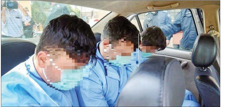
عکس از ایستگاه

سه مرد که در اقدامی جنون‌آمیز مرد کارت‌ن خوابی را به قتل رسانده و جسدش را در خیابان رها کرده بودند، با ردیابی کارآگاهان پلیس آگاهی شناسایی و دستگیر شدند. به گزارش خبرنگار جام‌جم، ساعت یک بامداد ۲۲ مهر امسال مردی در تماس با پلیس ۱۱۰ از کشف جسد مردی در یکی از محله‌های فردیس استان البرز خبر داد. در ادامه تیمی از ماموران همراه بازپرس جنایی در محل قتل حاضر شدند. بررسی‌های اولیه حکایت از این داشت که این مرد در محل دیگری به قتل رسیده و عاملان جنایت جسدش را به آنجا منتقل و رها کرده بودند. آثار ضربه‌های قمه روی بدن این مرد دیده می‌شد. ظاهر مقتول نشان می‌داد او کارت‌ن خواب است و هیچ مدرک شناسایی همراه نداشت. جسد با دستور قضایی به پزشکی قانونی منتقل شد و کارآگاهان تحقیقات برای شناسایی هویت مقتول و ضارب‌ان را آغاز کردند. در نخستین گام به تحقیق از مردی که با پلیس تماس گرفته بود پرداختند که اظهار داشت: «شب در حال عبور از این خیابان بودم که متوجه خودرویی شدم که راننده‌اش با سرعت بالایی رانندگی می‌کرد. او ناگهان کنار خیابان ترمز کرد و سه نفر از ماشین پیاده شده و جسد را از صندلی عقب بیرون کشیده و همان‌جا رها کرده وگریختند.»