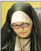
شیدآسلامی کارشناس رسانه

شبکه پرس تی‌وی با ساخت آثار متنوع سعی در روشنگری سیاست‌های دوگانه غرب دارد