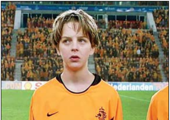
مجرای جشنواره تلویزیونی «به رنگ نارنجی»

جشنواره تلویزیونی، «به رنگ نارنجی» به کارگردانی «جورام لورسن» است که چهارشنبه ۲ آذر ساعت ۲۳ و ۴۵ دقیقه از شبکه امید پخش می‌شود. این فیلم که با بازی یانیک ون دی‌ولدی، توماس اکداووندی دجکی است روایتگر پسری ۱۱ساله وپاهوش است که به بازی فوتبال علاقه فراوانی دارد. او آرزو می‌کند که در تیم ملی فوتبال نوجوانان زیر۱۲ سال انتخاب شود.