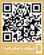
کیونگرکد را اسکن کنید