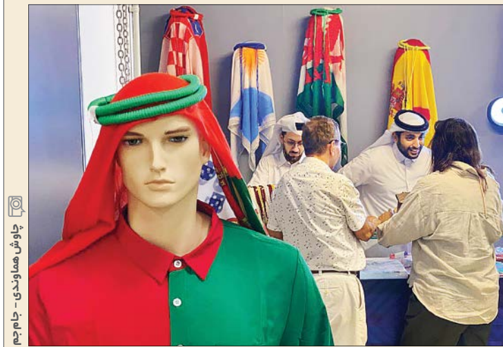
چاپش هاشاودنی - جام جم

مبارزه کشورهای مختلف برای کسب میزبانی جام جهانی تنها دلییل ورزشی ندارد، کمک های مالی فیفا به این کشورها و البته فراهم کردن زیرساخت های ورزشی برای کشورهای میزبان، فقط یکی از مستحیات این میزبانی است. اما در کنار این دلایل، رونق اقتصادی برای جوامع بومی از حضور بی شمار گردشگران در آن کشور هم می تواند دلیل مهمی در این مبارزه باشد. اتفاقی که حالا قطر را یکی از برندگان قطعی جام جهانی به لحاظ اقتصادی کرده است. شلوغی بازارها و پاساژهای این کشور با شور و حال حضور گردشگران باعث شده مردم این کشور هم از این میزبانی منفعت بسیاری ببرند.