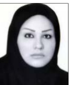
مهاکمه درودی گروه رسانه

صنعت تلویزیون هنگ‌کنگ که تلاش دارد با تولید مجموعه‌های جذاب و سرگرم‌کننده تماشاگران بومی را به سمت خود بکشاند، در تازه‌ترین حرکت هنری به دنبال تولید دو مجموعه پرتحرک و اکشن برمبنای داستان دو فیلم بسیار موفق صنعت سینمای کشور خود است. با آغاز کار نگارش فیلمنامه‌های دو مجموعه «بی‌باک» (که با عنوان «نترس» هم معرفی شده) و «جنگ سرد» و علاقه‌مندان و دوستداران آثار پلیسی حادثه‌ای هنگ‌کنگی متوجه شده‌اند این دو فیلم بسیار موفق هنگ‌کنگی قرار است نسخه‌هایی برای قاب کوچک شوند. تحلیلگران اقتصادی سینما از این دو نسخه سینمایی به عنوان پرفروش‌ترین فیلم‌های تاریخ سینمای هنگ‌کنگ نام می‌برند و منتقدان سینمایی هم یکصدا تحسین‌کننده آنها بوده‌اند. هر دو فیلم نمایش‌های بسیار موفقی در چین و بسیاری از کشورهای قاره آسیا و همچنین اروپا و استرالیا داشته‌اند.