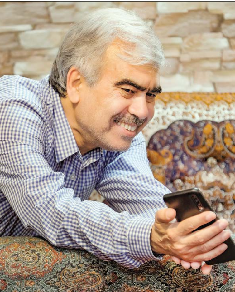
دکتر احمد شاه فرهت در نمایشی از مستند «فرهت»

[۴] استقبال او ابتدا و در روند کار نسبت به قرار گرفتن مقابل دوربین چطور بود؟