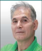
میکائوس ریزاریکروه فریگ و هنر

زمانی که تهیه‌کنندگان درام ضد تبعیض نژادی «رهایی» اعلام کردند آن را برای روزهای پایانی سال جاری میلادی روانه اکران عمومی می‌کنند، این نظریه مطرح شد که چنین کاری در شرایط فعلی درست نیست و مردم عادی که عموم تماشاگران سینما را تشکیل می‌دهند، هنوز خاطره سیلی اسکاری ویل اسمیت، بازیگر اصلی این فیلم را به یاد دارند و این موضوع به احتمال زیاد روی وضعیت نمایش عمومی رهایی تاثیر منفی خواهد گذاشت.