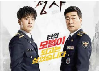
سریال کره‌ای کارآگاه خوب از شنبه تا پنجشنبه هر هفته ساعت ۱۹ پخش می‌شود

می‌کند. هردوی آنها با هم کار می‌کنند و اغلب اوقات با هم دیده می‌شوند ولی روش‌های بررسی پرونده‌های جنایی آنها با هم متفاوت است و ماجراهایی را رقم می‌زنند. سریال کره‌ای کارآگاه‌خوب از شنبه تا پنجشنبه هر هفته ساعت ۱۹ پخش می‌شود وتکرار آن ساعت ۲۳ و ۲۰ دقیقه خواهد بود. مخاطبان می‌توانند خلاصه قسمت‌های این سریال را روز جمعه ساعت ۱۹ مشاهده کنند.