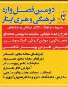
دومین فصل‌واره فرهنگی و هنری ایثار