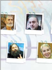
معرفی داوران جشنواره تئاتر بسیج

طبق جدول زمان بندی جشنواره، ۱۵ نمایش صحنه‌ای راه‌یافته به مرحله نهایی سیزدهمین جشنواره سراسری تئاتر سودای عشق، اجراهای خود را در سالن‌های تئاتر بوشهر از روز دوشنبه ۲۸ آذر آغاز می‌کنند و آخرین نمایش شرکت‌کننده در این بخش نیز روز پنجشنبه اول دی‌ماه سال جاری روی صحنه می‌رود.