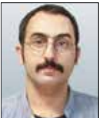
علی رستگار گروه فرهنگ و هنر

اگر علی صفائی‌حائری را می‌شناسید و با شخصیت، افکار و آثارش آشنایی دارید و چه‌بسا علاقه‌مند او هستید، قطعا از تماشای مستند «برای پس از مرگم» لذت می‌برید و اگر هم هیچ شناختی از او ندارید، با دیدن فیلم به این شناخت می‌رسید و حتی به او علاقه‌مند می‌شوید. به‌ویژه مخاطبان سینما در مواجهه با شخصیت این روحانی متفاوت غافلگیر می‌شوند و غافلگیری زمانی بیشتر می‌شود که در فرامتن بداندند فیلم «زیر نور ماه» با نگاهی به سیره علمی او نوشته و ساخته شد. زندگی کوتاه اما پربار او، مثل یک فیلم سینمایی جذاب دراماتیک بود و دشمنی‌ها، مخالفت‌ها و گرفتن انگشت اتهام به سمت او، صفائی‌حائری معروف به عین. صاد را با قهرمانان هیچکاک‌ی برابر می‌کنند. کسی که با وجود ارادت به نظام، انقلاب و امام و نوشتن این جمله که «امام، امیر حادثه‌هاست و ما اسیر حادثه‌ها» اما به دلیل نگاه و اندیشه متفاوت، با تندترین انتقادها روبه‌رو شد. در گفت‌وگو با عبدالرضا نعمت‌اللهی، تهیه‌کننده و کارگردان مستند تماشایی «برای پس از مرگم» که از آثار حاضر در مسابقه بلند ملی و جایزه شهید آوینی شانزدهمین دوره جشنواره بین‌المللی سینماحقیقت است، به فیلم و جنبه‌های مختلف شخصیت صفائی‌حائری پرداختیم؛ کسی که به قول بیژن بیرنگ «زند بازار، نبود و جای پای عمیقش همیشه باقی است.