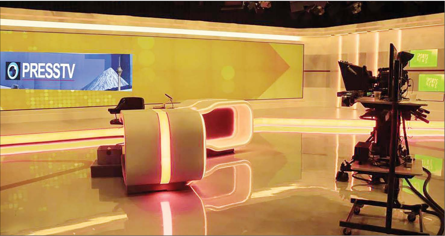
اروپا و آمریکا با تحریم پرس‌تی‌وی، آزادی بیان را نقض کردند

بیشتر از ۷۰ سال قبل بود که جورج اورول در کتاب قلعه‌حیوانات جمله معروف خود را گفته‌بود که «همه با هم برابرند اما برخی برابرترند». انگار رابطه دنیای غرب با رسانه‌های غیروابسته و مستقل، ام‌ا رسانه‌هایی که می‌کوشند به شکل آزاد فعالیت کنند، در تیررس حملات غرب و مجامع غربی قرار می‌گیرند تا صدای مردم از گلویشان خارج نشود. نکت‌های که به وضوح در تحریم پرس‌تی‌وی و حملات گاه به گاه غرب به رسانه‌های مستقل ایرانی هم دیده می‌شود و در مقابل، آن‌هایی که تحت عنوان ایران و بین‌المللی بودن فعالیت می‌کنند، تنها تشویق به آشوب می‌کنند و مدای مخالف را تاب نمی‌آورند. این‌که چرا این نبرد نابرابر در عرصه رسانه شکل گرفته، اتفاق تازه‌ای نیست اما کالبدشکافی و تحلیل آن، می‌تواند بسیاری از تلاش‌های غرب برای خاموش کردن صدای ایران را آشکار کند. در همین رابطه با برخی کارشناسان مسائل بین‌الملل صحبت کردیم و نظر آنها را درباره این نوع برخورد متناقض کشورهای غربی جویا شدیم.