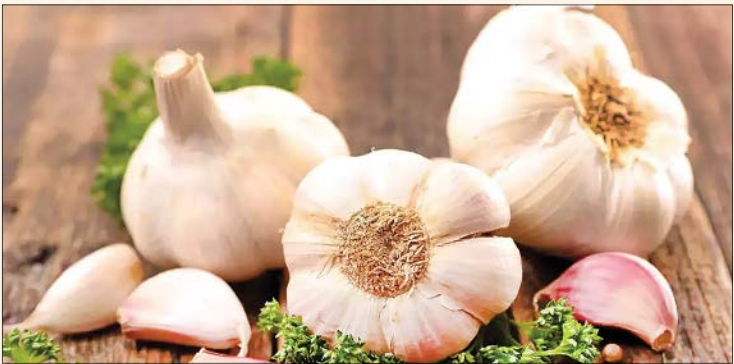
فاخره بهبهانی فروغ دانش و سلامت

خیلی‌ها از سیر برای کاهش فشار خون استفاده می‌کنند و براساس یک باور قدیمی معتقدند که سیر می‌تواند مهارکننده فشار خون بالای آنها باشد، حتی گاهی خودسرانه داروهای شیمیایی‌ی کاهنده فشارخون‌شان را کنار گذاشته و روزانه از سیر به هر شکلی در قالب روغن سیر، قرص سیر، حبه سیر یا موسیر استفاده می‌کنند. آیا واقعاً سیر و فرآورده‌های آن می‌تواند مهارکننده پرفشاری خون باشد؟ از دیدگاه طب سنتی، سیر طبیعت گرم و خشک دارد و از نظر گرمی درجه سه است. یعنی گرمی خیلی زیادی دارد به طوری که گرمی درجه چهار به سمیت محصول منجر می‌شود. سیر در مناطق کویری با آب و هوای گرم و خشک یا نیمه‌خشک همچون همدان یا تهران، بوی بیشتر و تند و تیزتری دارد اما در نواحی شمال‌کشور که رطوبت هوا بیشتر است، سیر تندی کمتری دارد و عقیده بر این است که هرچه سیر بودارتر باشد، پرخاشی‌تر است. البته در منابع طبّی آمده که اثرات سیر کوهی، قوی‌تر از سیر باغی است. سیر کوهی همان موسیر است که در مقایسه با سیر تازه بلوبی یا باغی، بری کمتر ولی فواید بیشتری دارد و توصیه شده برای این‌که از منافع و خواص سیر بهره‌مند شوید می‌توانید از موسیر استفاده کنید.