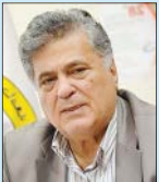
دکتر امیر خسرونی متخصص سلامت داخلی-گوارش

با نشانه‌هایی که به آن اشاره می‌کنید، احتمالاً دستگاه گوارش شما با «نوروویروس» آلوده شده است. به این ویروس، ویروس استفرغ زمستانی نیز می‌گویند. شما حتماً نیاز به معاینه بالینی و مراجعه به متخصص گوارش دارید تا علت دقیق بیماری شما مشخص شده و درمان لازم آغاز شود اما فرض را بر این می‌گذاریم که علت بیماری شما همانی است که به آن اشاره شد. این ویروس معمولاً در فصل زمستان شایع است و با سرد شدن دمای هوای‌تان می‌توان منتظر این ویروس بود. آلودگی با این ویروس می‌تواند باعث التهاب دستگاه گوارش شده و با کسالت شدید، حالت تهوع، استفراغ، اسهال آبی، سردرد و درد بدن همراه است. نشانه‌های بیماری معمولاً ۱۲ تا ۴۸ ساعت بعد از مصرف غذا یا آب آلوده به این ویروس یا دست زدن به دهان یا مصرف غذا با دست آلوده به این ویروس آغاز می‌شود. تماس نزدیک با فرد مبتلا به ویروس نیز باعث ابتلا به بیماری می‌شود. باید در این فصل پیش از مصرف غذا حتماً دست‌ها را شسته و غذای سالم مصرف کنید. از حضور در مکان‌های پر ازدحام خودداری کرده یا از ماسک استفاده کنید.